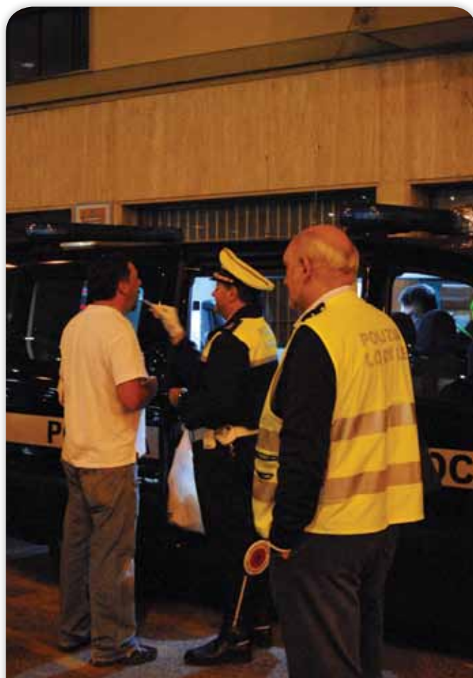
Polis genomför test avseende narkotikapåverkan hos bilförare med Biosensors utrustning.

Teckningsförbindelser och garantiteckning: Biosensor har erhållit teckningsförbindelser om 6 000 000 SEK (motsvarande 36,2 % av den totala emissionslikviden) och garantiteckning om 5 240 000 SEK (motsvarande 31,6 % av den totala emissionslikviden), totalt 11 240 000 SEK (motsvarande 67,8 % av den totala emissionslikviden).