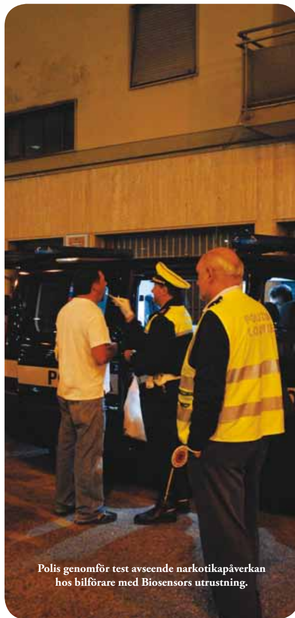
Polis genomför test avseende narkotikapåverkan hos bilförare med Biosensors utrustning.

Biosensor har erhållit teckningsförbindelse om 1 650 000 SEK och garantiteckning om 19 265 378,40 SEK; totalt 20 915 378,40 SEK, vilket motsvarar hela den initiala emissionsvolymen.