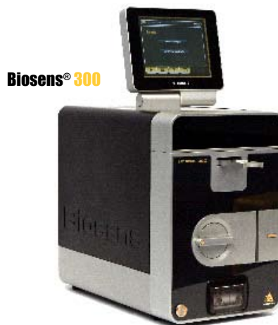
Biosens ® 300