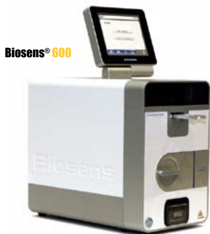
Biosens ® 600

Bolaget har under året fortsatt arbetet med kvalitetssäkrade processer och produktion enligt ISO 9001:2008. Det har också kontinuerligt arbetats med att bygga upp och säkerställa produktionskapacitet för produkterna Biosens ® 300 och Biosens ® 600 vilket utförs i samarbete med Orbit One (kontraktstillverkare) och olika underleverantörer. De första batcherna av Biosens ® 300 tillverkades och produkten gick också under år 2009 i drift hos en svensk myndighet.